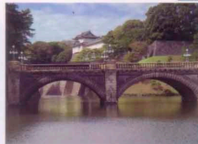
皇居勤労奉仕 日時：6月25日～28日 場所：皇居・赤坂御用邸