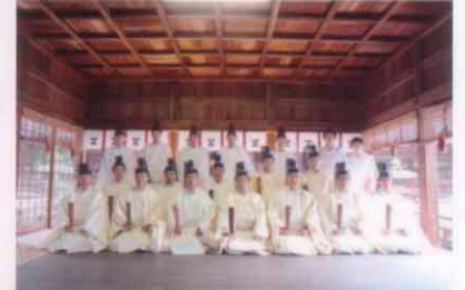
明治維新150年祭齋行 日時：4月6日 場所：野田神社