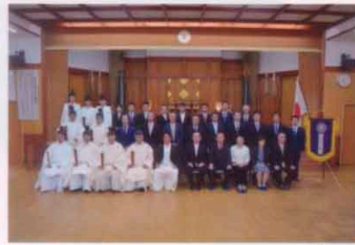
創立70周年奉告祭齋行 日時：5月29日 場所：山口県神社庁